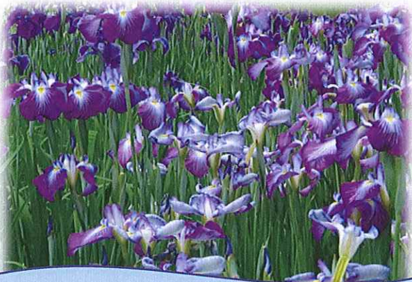
新発田市：あやめ園